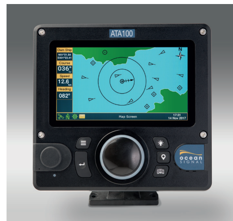
Écran couleur 7 pouces, haute luminosité

Il est également conforme aux normes UE en vigueur pour les voies navigables, administrées par la CCNR.